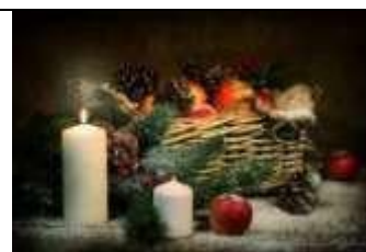
А) Новый год